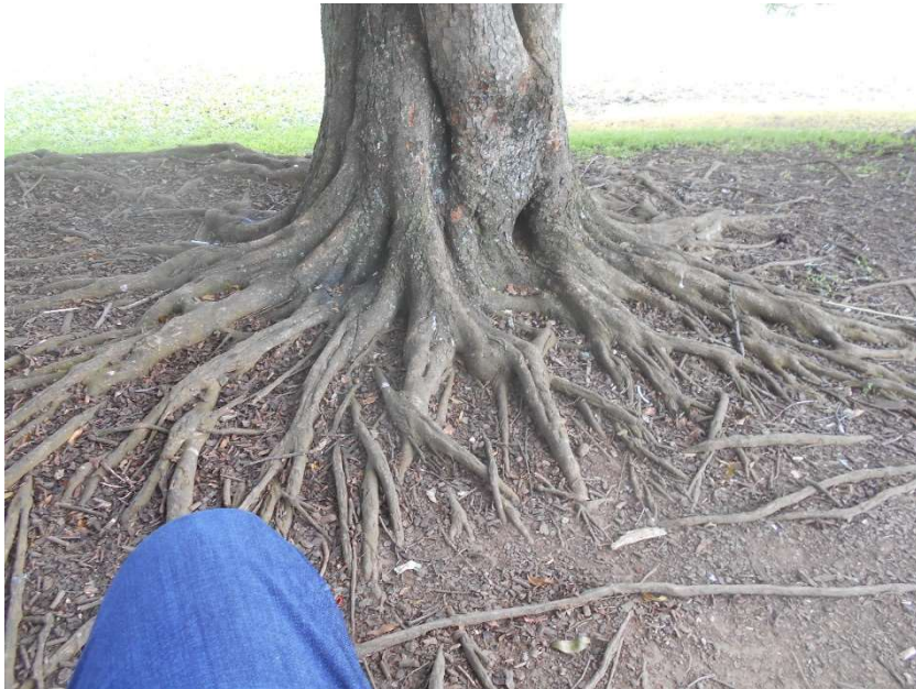
1. Trädrötter. Satt bra och länge på en skön bänk. Damm med fåglar framför mig, en ekorre några meter till höger. Men rötter räckte fint för att må bra.

Första dagen riktigt framme i Latinamerika efter två resdagar och en återhämtningsdag. Sov bra. Ut klockan 9 och gick några kilometer till den stora parken La Sabana. Inte i sig finare än t.ex. Slottsskogen i Göteborg. Men andra växter och djur, och glädjen och stoltheten över att jag tagit mig själv hit. Jag gillar Latinamerika. Costa Rica är en bra start på resa, för landet fungerar väl och är delvis Europalikt. Jag hade en av årets hittills bästa dagar idag. Satt t.ex. och bara tittade på trädrötter helt närvarande och mådde bra.