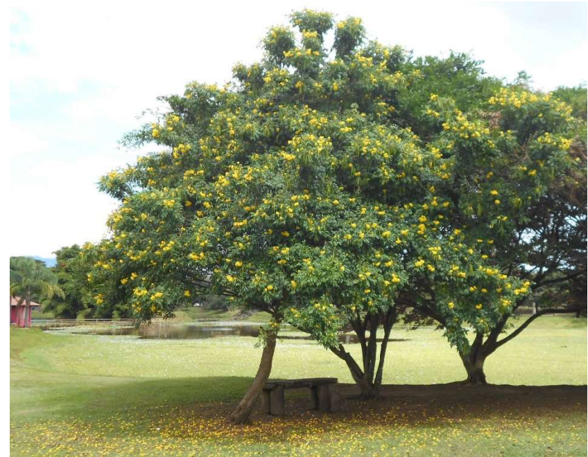
2. Vackra väldoftande träd med trumpetformade blommor, i La Sabana.