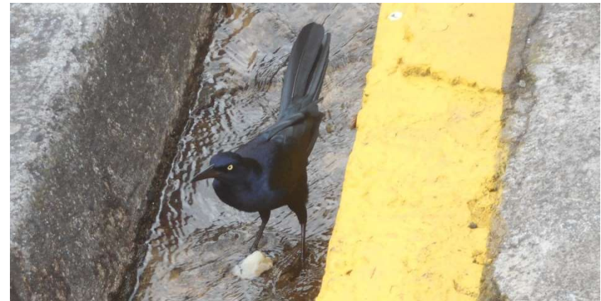
3. Svart fågel. Den här sortens fåglar sitter ofta i träd och sjunger vackert. Lite som kombination av och koltrast och stare, fast mer intressant sång. Men just det här exemplaret åt en brödbit uppblött i vatten när jag störde.