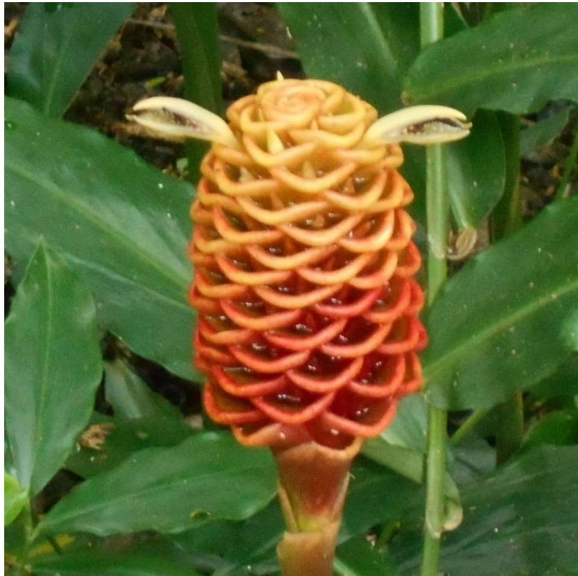
4. Den här växten finns alltså på riktigt, i San José's botaniska trädgård.

Tog taxi till nästa park. Taxichauffören var trevlig och pratade bättre engelska än jag spanska. 55 kronor. Jag uppskattar sällan djur i bur, men det här var ganska likt Djurens ark, inget kommersiellt ställe. Besöket blev en lugn promenad i tropisk skog med vackra fjärilar och lukter av mossa. Satt och mediterade och trivdes. Växterna var minst lika vackra som djuren. Efter parkbesöket gick iqt ganska kort väg hem. Köpte lunch och åt i park, och handlade sen kvällsmat, och kom fram till hotellet när det började regna.