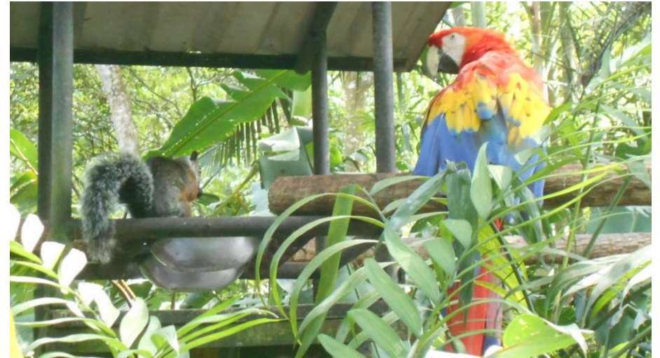
5. Stor färgrik papegoja tittar på ekorrar som äter mat djurskötarna lägger ut. Dessa fåglar och ekorrar var inte i bur.