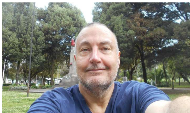
1. Satt i park (Ejido idag) som alla dagar

Idag var jag ute sex timmar. Trivs bra här. Fick gå och leta lite efter allmänna kommunikationer.