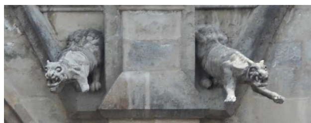
4. Gargoyler utanpå basilikan.