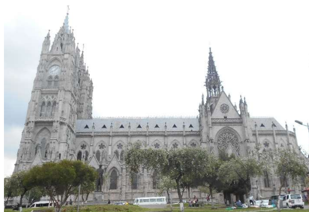
3. Basilikan i Quito