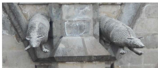
5. Gargoyler utanpå basilikan. Bältdjur?