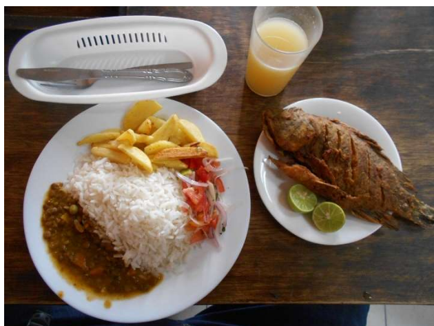
2. Lunch för 2 US Dollar. Grillad fisk till höger. God kycklingsoppa till förrätt ingick också!