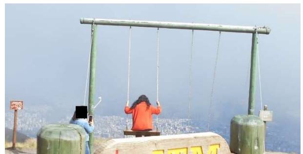
4. Jag gungade där hon i rött sitter. Skönt!