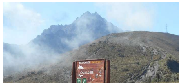
5. Promenad till himlen?