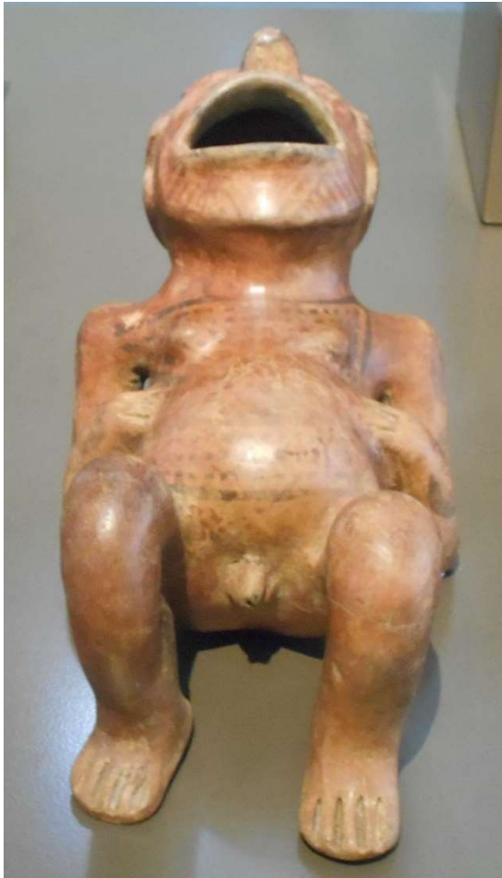
1. Den här figuren får ni tolka själva. 2000 år ca.

Förmiddag på Museo de Arte Precolombino .