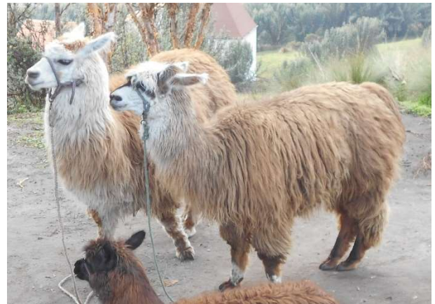
3. Passerade lamadjur

Jag hade extremt sköna och givande timmar i Anderna 4000 m.ö.h. på onsdagseftermiddagen. Bilkötaxi och sen linbana (teleférico) högre upp. Skön luft, tyst, meditativa utsikter, klara färger. Gick till flera utsiktsplatser och satt länge där. Andfåddhet vid gående uppför, inte illa alls.