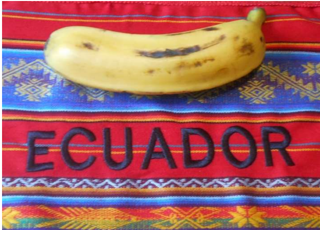
1. Den tjockaste banan jag sett, på fin duk

Igår kväll firades Quito Fest på gatan utanför med trummor och annan musik. Åt stor frukost på matställe och handlade mat på morgonen. Zoom-träff med autister i Sverige kl. 10–11, vilket jag uppskattar mycket.