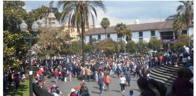
3. Del av Plaza Grande , tagit utanför katedralen

Regnet avtog och när jag kom till Plaza Grande sken solen. Jag torkade en bänk, och satte mig. Tittade på människor, och det är intressant här. En medelålders man stötte på mig. Smickrande iofs, men jag ville inte mer. Vi pratade en stund.