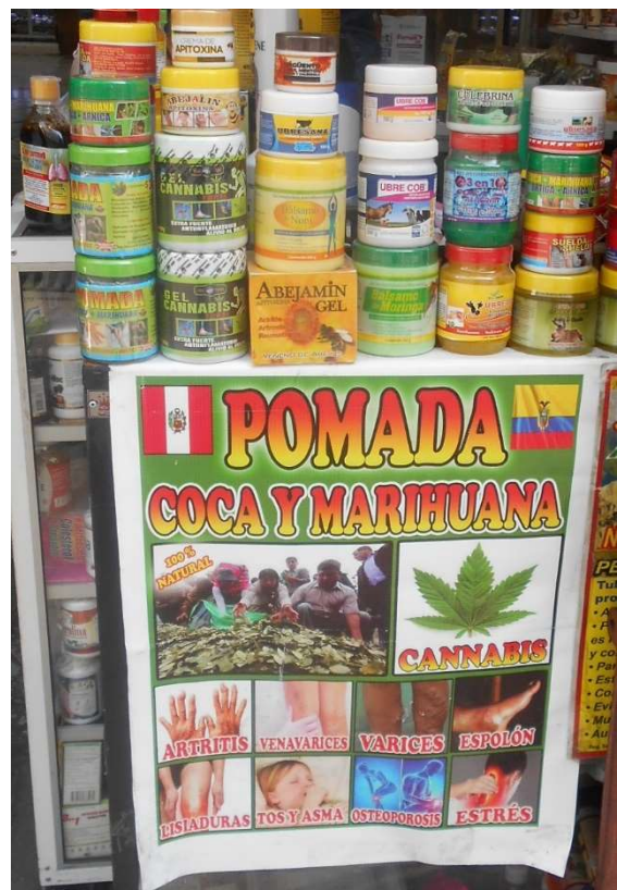
5. Hälsokost tar jag klart avstånd från!