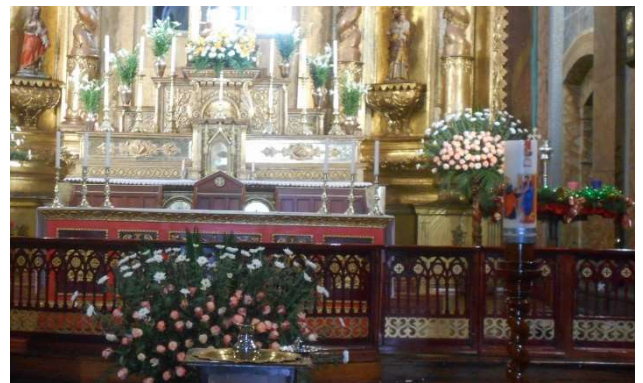
4. Överlastad kyrka. Jag fann inget lugn i den.