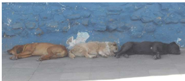
2. Tre hundar i rad sover i skugga på en trottoar

Cuscos katedral är ganska ointressant utvändigt. Invändigt har kyrkan ett överlasta ihopplock av smaklös ful barock och senare kompletteringar. De hade fotoförbud, så jag kan inte visa kitsch, överdrifter, komiska statyer, staplar av plaststolar m.m. Mest märktes turistgrupper med högt talande guider. Jag stannade fem minuter. Inträdet på 110 kronor (40 soles) känns som bedrägeri mot turister.