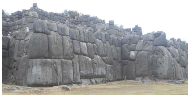
2. Del av de stora försvarsmurarna