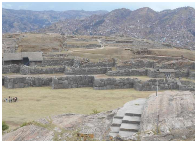
1. Från höjd med Inkatron ses försvarsmurarna