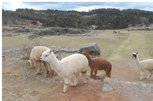
4. Gräsklippare, gick fritt och stördes inte