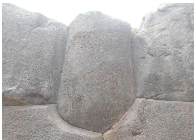
3. Ännu närmare, så syns hur Inkafolket byggde genom att passa ihop stenar