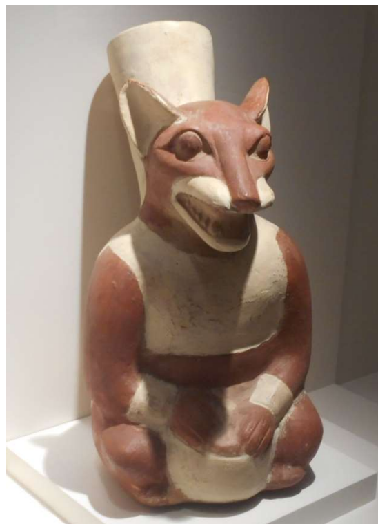
3. Moche. Räv