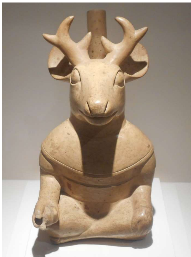
1. Moche. Hjort och människa

Idag ansträngde jag mig för att turista, istället för att mest tänka på krisen och dess hantering. Först museum med mycket vackra föremål från tiden innan spanjorerna. Sedan promenad till fornminne, akvedukt, blomgata och utsiktsplats. Fotografier av djurkeramikföremål på museet.