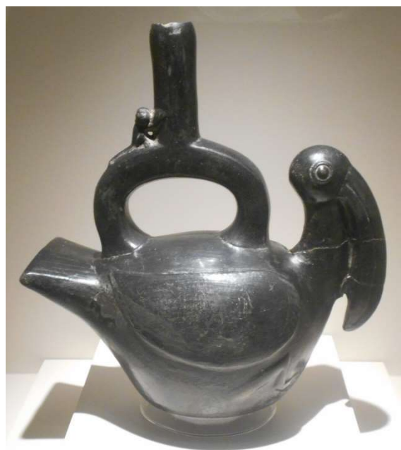
4. Chimu. Pelikan