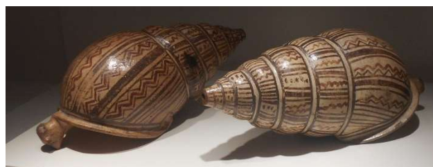
5. Inka. Landsniglar