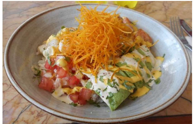
3. Resans nog godaste måltid hittills till lunch.

Langostinos flambeados, choclito, tomate y palta, hilos de camote frito sobre arroz japonés y salsa acevichada de ají amarillo