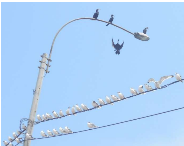
1. Skarvar och måsar vid kusten till Stilla havet

Ute hela dagen. Gick stigen ner till havet, mängder av vita fjärilar på de gröna branterna. Många vågsurfare. Tittade på havet i en timma.