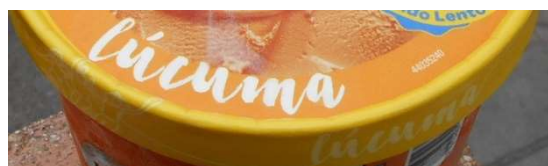
6. Lúcumá (frukt på träd) är en intressant smak. Drack likör av det på julafton. Ikväll i en rund park föråt jag nog mig på lúcumá-glass.