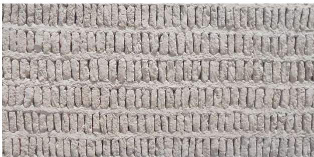
2. Väggar på Huaca Pacllana visar tekniken.

Taxi till Huaca Puellana , ett stort tempelområde med pyramid från Lima-kulturen år 200–700. Byggt av tegelstenar stående med mellanrum för att klara jordbävningar. Leran håller då Lima får 20 mm regn per år. En timme guidad tur.