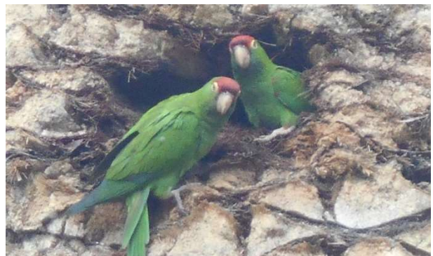
4. Gröna medelstora papegojor i parkpalmhål