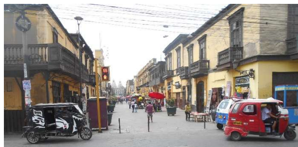
1. Stadsdel norr om ån, med slitna kolonialhus, amatörledning, och primitiva taxis

En flod som heter Rimac går på norrsidan av Limas gamla centrum. Den är viktig då staden får sitt vatten därifrån, men inte mycket att se. Ett betongdike med lite vatten och skräp. Och på norrsidan om ån en hemsk stor motorled. Jag gick en gångbro till stadsdelen norr om ån. Det var en positiv upplevelse med trevligt levande stadsliv och mycket lägre andel turister.