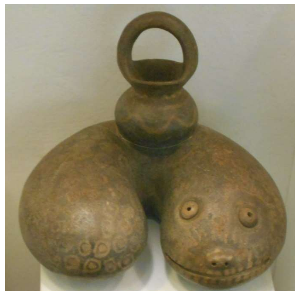
3. Från permanenta utställningen. Bra enkelhet.

Museets permanenta utställningar visade föremål från alla gångna kulturer i området. Dessutom: Modern folkkonst, Perus mynt och sedlar, och på översta våningen oljemålningar.