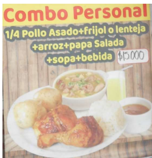
1. Dagens middag. Enkel och billig. 35 kronor.

Hotellet valde jag för närhet till stora parker. Det ligger 6–8 km från Bogotás gamla centrum. Sjätte våningen så motorleden utanför går an. Flera billiga matställen ligger intill hotellet. Man kan få panik av alla nollorna på priser.