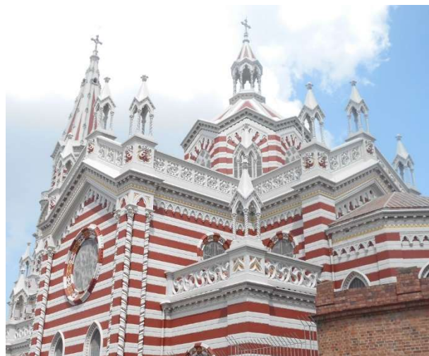
3. Santuario Nuestra Señora del Carmen

Gick runt lite. Svårt att motstå gatumatställen med empanadas och annat gott för max 10 kr. Sen mot en kyrka som jag har sett fram emot. En nygotisk sagokyrka med samma känsla som Oscar Fredriks i Göteborg, men i andra färger.