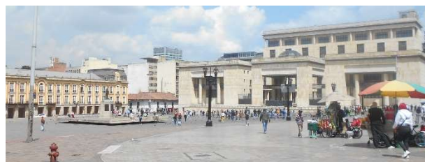
5. Stora torget Plaza de Bolívar är omgivet av katedral, kongressbyggnad m.m. Byggnaden t.h. gör stilblandningen för hemsk. Mest duvor där.

Taxi till Parque de los Novios intill hotellet. Läste där en stund. Åt igen. Regn nu på kvällen.