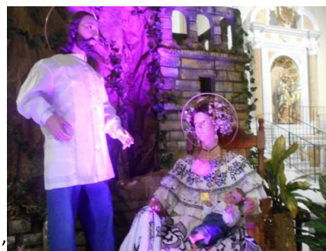
6. Jehovas vittnen kunde inte gjort det sämre