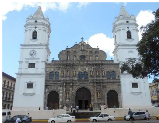
5. Katedralen i Panama City

Jag kommer aldrig uppskatta katolsk estetik utöver renässansen. Be inte mig förklara. Bilderna nedan är från Catedral Basílica Metropolitana Santa María La Antigua .