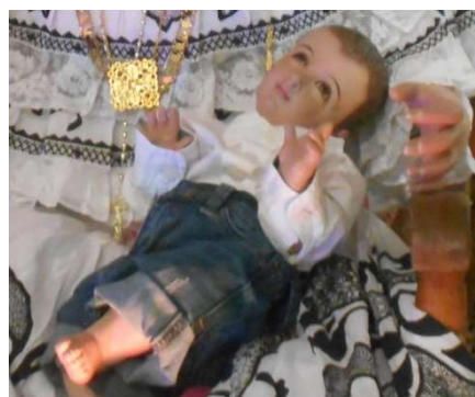
7. Jesusbarn, med uppkavlade jeans