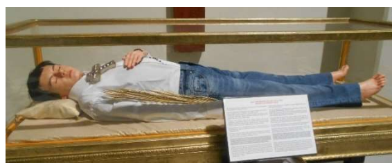
8. Katolskt helgon