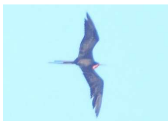
4. Fregattfåglar (bild), pelikaner och svalor sågs

Jag kommer aldrig uppskatta katolsk estetik utöver renässansen. Be inte mig förklara. Bilderna nedan är från Catedral Basílica Metropolitana Santa María La Antigua .