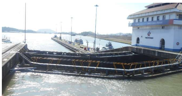
2. Slussarna lyfte båten 26 meter upp