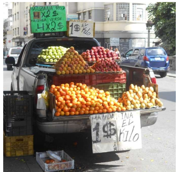
4. Fruktförsäljning från bilflak

Caracas känns livfull och konstnärlig för mig. Folk är inte otrevliga. Katter och hundar finns. Samtidigt har staden blivit nedgången och fattig.