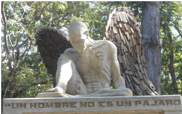
1. Skulptur i parken. Ikarosmotiv.

Resan första kackerlacka mötte jag i natt. Ute i Caracas i 6 timmar och det var mycket givande. Först letade jag efter en busshållplats och mötte en gul fågel och en del stadsliv. Sedan gick jag genom den stora parken Parque Los Caobos . Där fanns stora fina gamla träd och skulpturer.