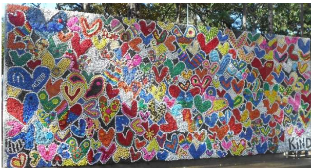
2. Plastkapsyl-konstverk i parken.

Sen Plaza Venezuela som inte var något särskilt. Handlade och åt mat och dryck i flera gatustånd. Priserna varierar enormt: En ville ha 9 USD för 1,5 liter apelsinjuice i en butik. Sen jag åt lunch med soppa, kyckling&ris och dryck för 6 USD. Spanskan har jag klart svårare att förstå här.