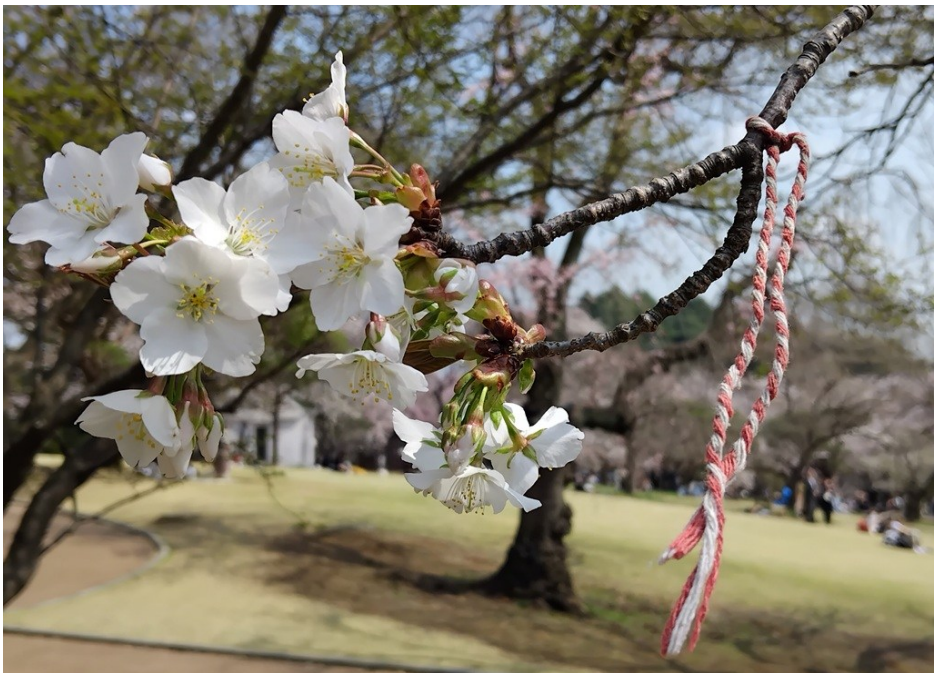
Vita körsbärsblommor och ett martenitsa-snöre för lycka