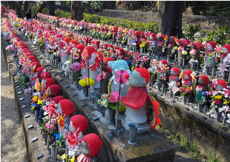
Barnskyddsandar vid ett tempel (igår)