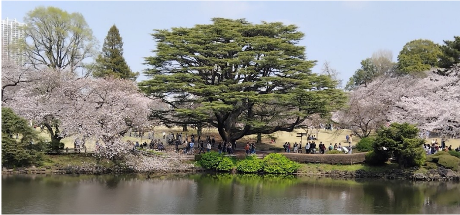
Träden i miljön Shinjuku Gyoen var oerhört vackra.