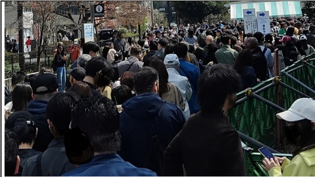
Ovan: Skräck-kö till parken idag.

Jag fick avstå flera ställen jag velat besöka, men inte klarade ta mig till. Sen satsade jag på bara parken Shinjuku Gyoen för hela eftermiddagen. Kom till huvudingång. Pga helg och körsbärsblom ville alla japaner in. Idag var man tvungen att med teflon reservera att få gå in vid viss tid. Jag stod i solen i 45 minuter och misslyckades att reservera på teflon. Det var obehagligt och mycket krävande.