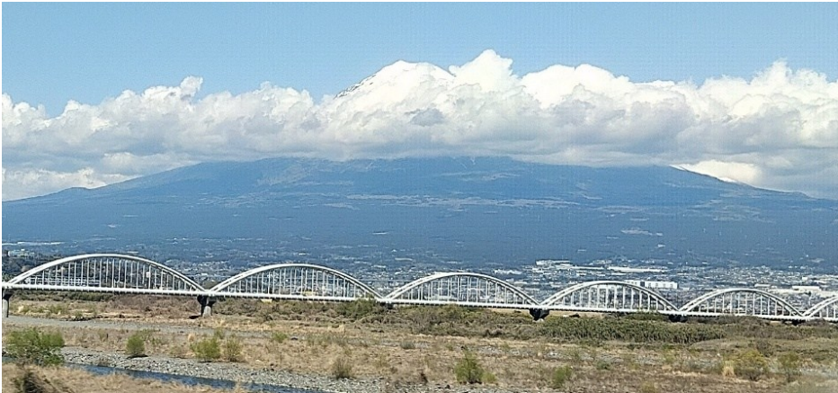
Berget Fuji från Shinkansen-tåget, tyvärr med bergstoppen dold av moln

Klockan 8–11 låg jag i sängen och gled in och ut ur feberdrömmar. Gick till Kyoto station. Svettades, yr och behövde sitta ner ibland. Åkte Shinkansen -tåget åter till Tokyo utan problem. Tog mig ut från skräck-stationen. Taxi till mitt nya hotell. Resten av dagen i sängen.