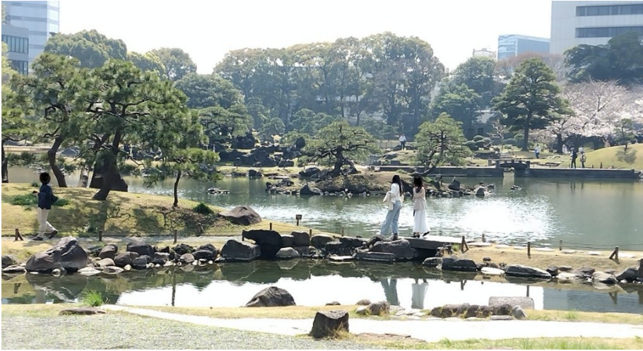
Kyū Shiba-rikyū , en fin liten park öster om Hamamatsuchō -stationen