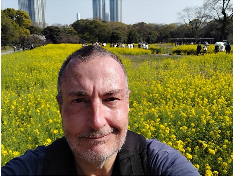
Hamarikyu Gardens (park två) med mig och gul blomsteräng.