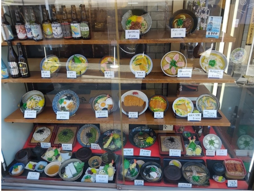
Matskyllfönster (med plastmodeller) från förlångtgåendet.

Templet Ginkaku-ji var inte lika fint och välskött som de föregående. Sen tog jag felbeslut och gick för långt. Templet Eikan-dō gick jag in på av misstag (trött och ont), i tron att det var Nanzen . Tunnelbana åter.