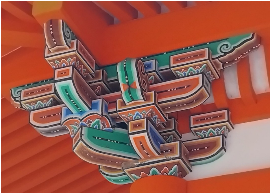
Detalj under tak