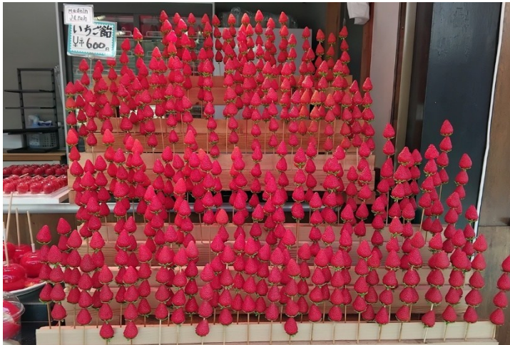
Mer plastmat ”Madein jaPah”