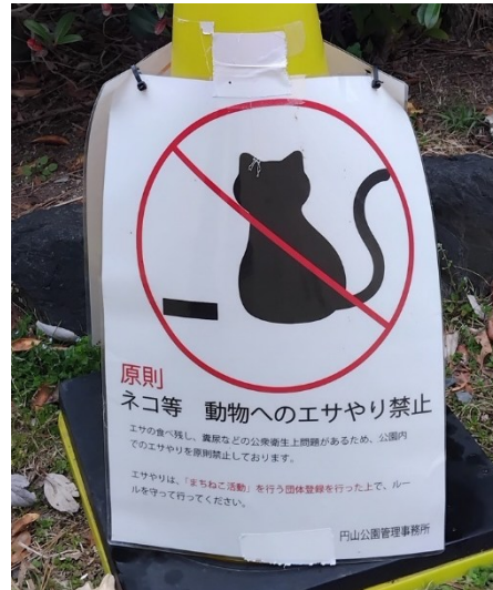
Mata inte den svarta katten.