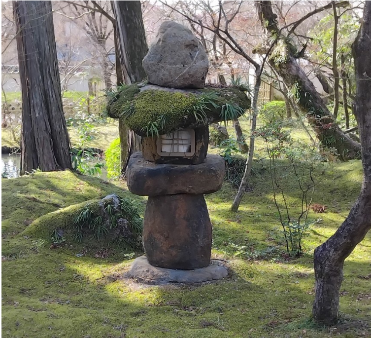
Mossa och något på Eikan-dō