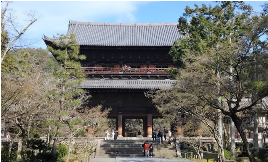
Nanzen-templet från gatan. Jag var för trött för att gå in efter jag gått dit.