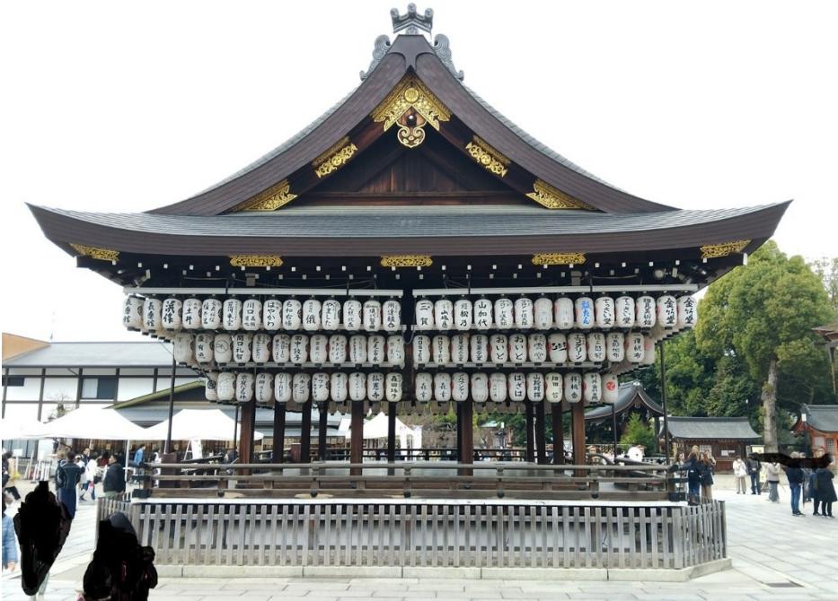
På gården. (Jag önskar jag kunde känna mer för Shinto-ställen.)