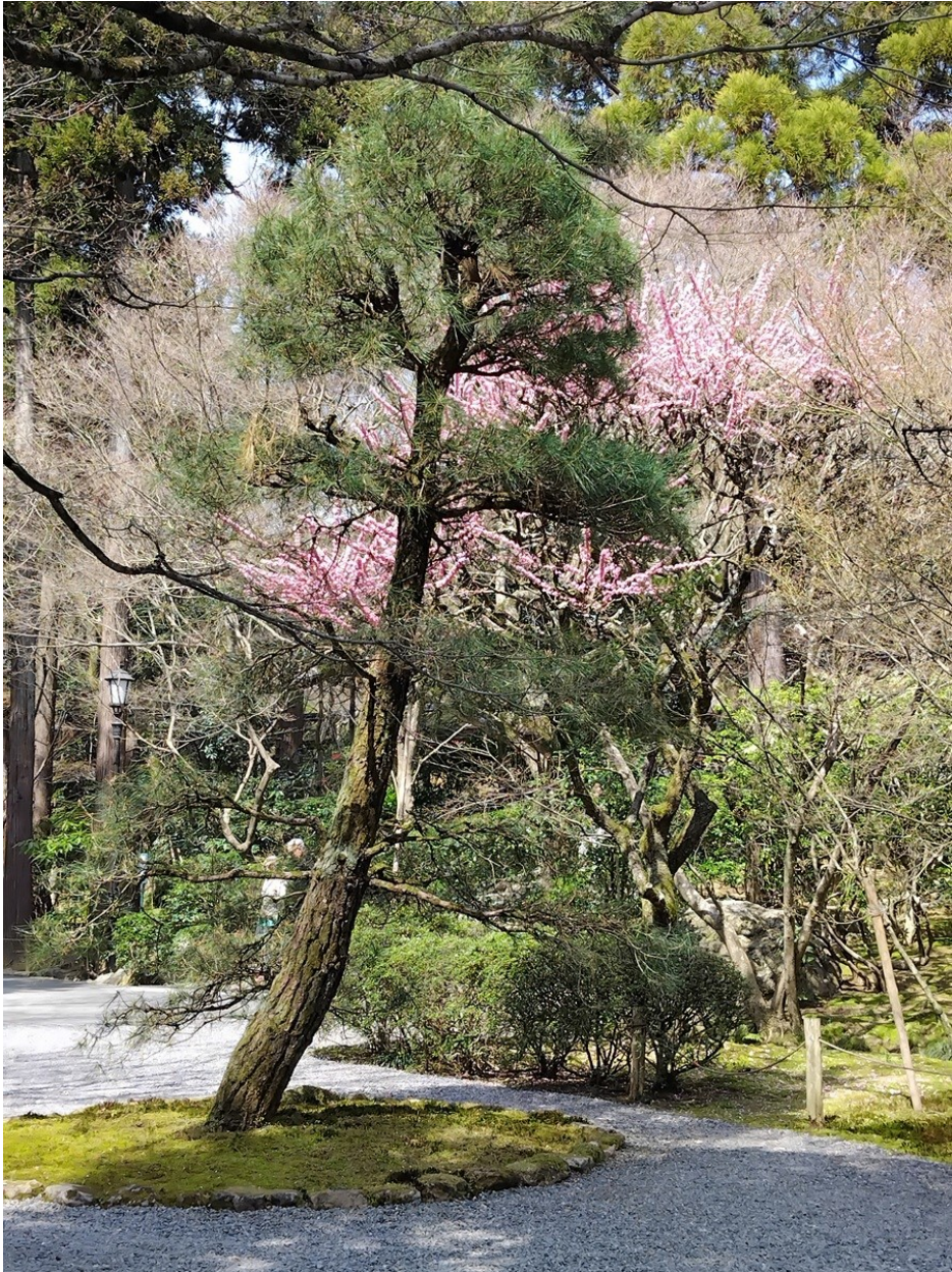
På Ryoanji-området satt jag längst med ovanstående vy framför mig. Enkelt och meditativt.