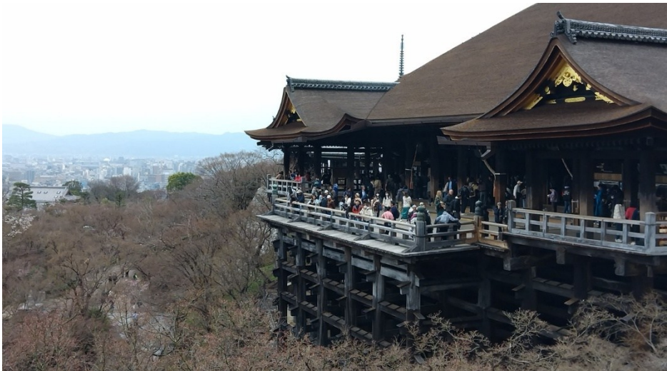
Stora trädäck med utsikt har Kiyomizu-dera