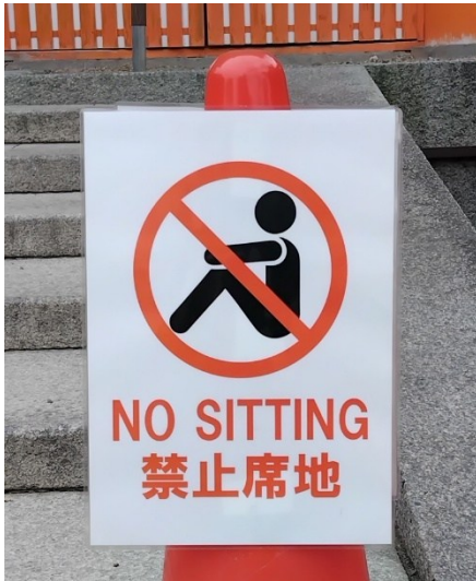
Helgedomen har inte sittplatser.