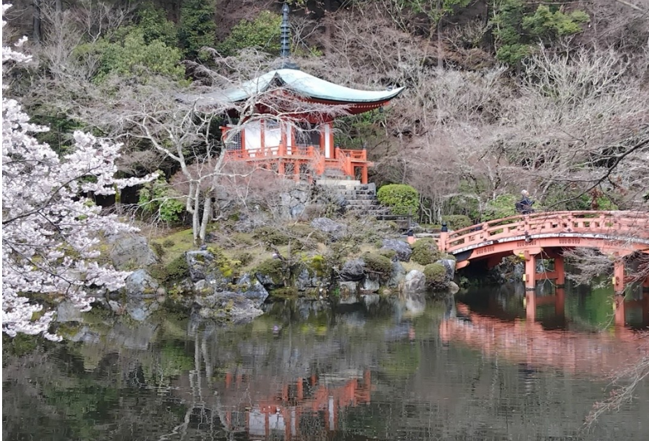
Bentendo (Benten-dō) , vid templet Daigo-ji i utkanten av Kyoto, Japan.

Åkte tunnelbana länge ut till en ytter-stadsdel. (Kyoto låter kanske litet, men har 1,5 miljoner invånare, 50% mer än Stockholm.) Gick uppför. Kom till templet Daigo-ji , fint med körsbärsblom, stor pagod m.m. Gick genom området och upp i skogen till mitt måste-mål Bentendo . En liten tempelbyggnad vid en damm, som är ett känt vackert motiv som finns på pussel i höstfärger. Det var vackert även nu i körsbärstid.