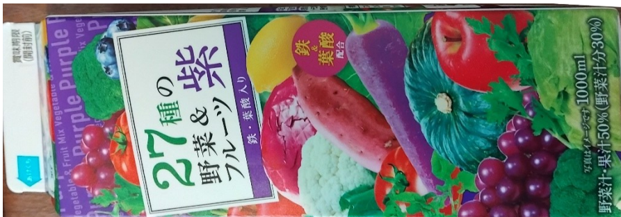
Medicin på kvällen: Lila grönsaksjuice, torkad bläckfisk och sen Sake.