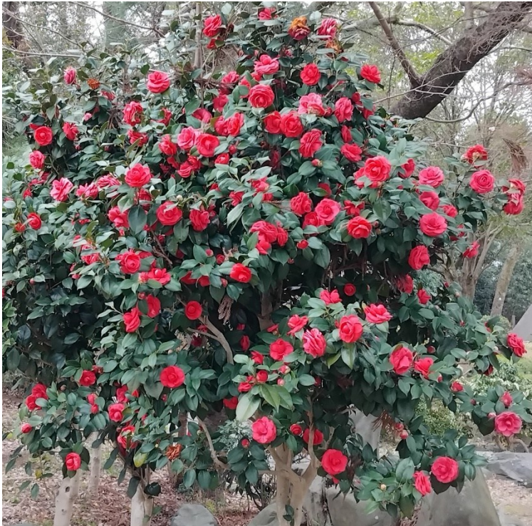
Litet blomträd, i park bredvid helgedomen