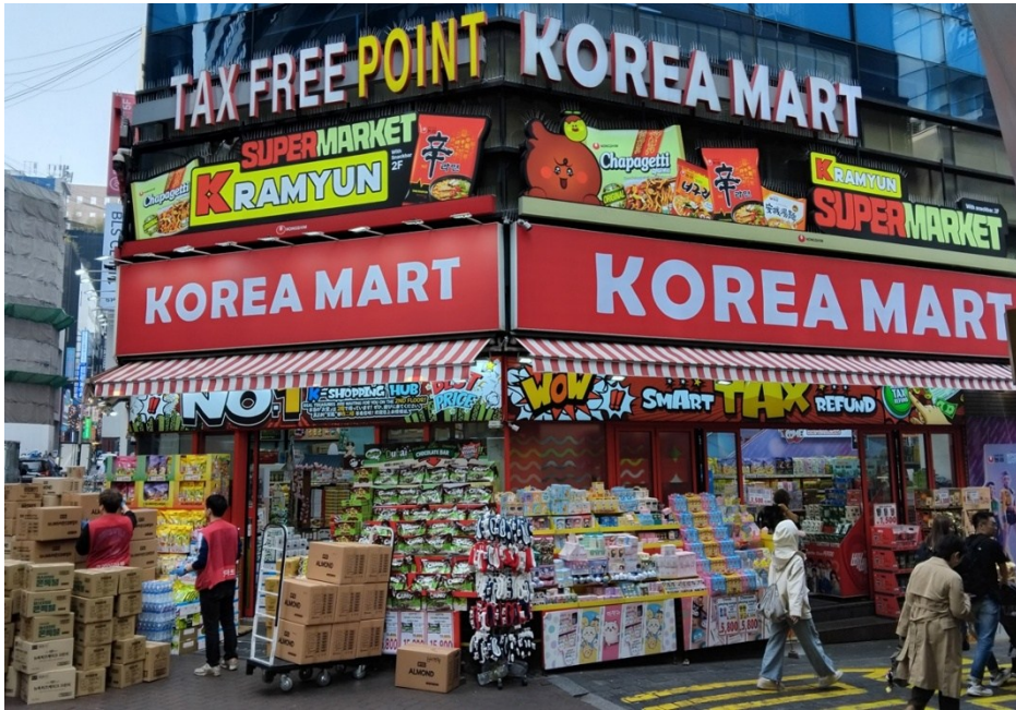
En koreansk affär