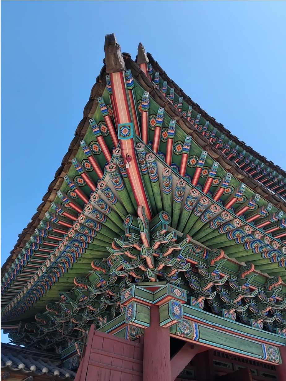
Detalj från byggnad på Changdökkung

Det östra palatset heter Changdökkung . Började bli trött efter att gått för långt. Bäst var att sitta vid en större naturdamm.