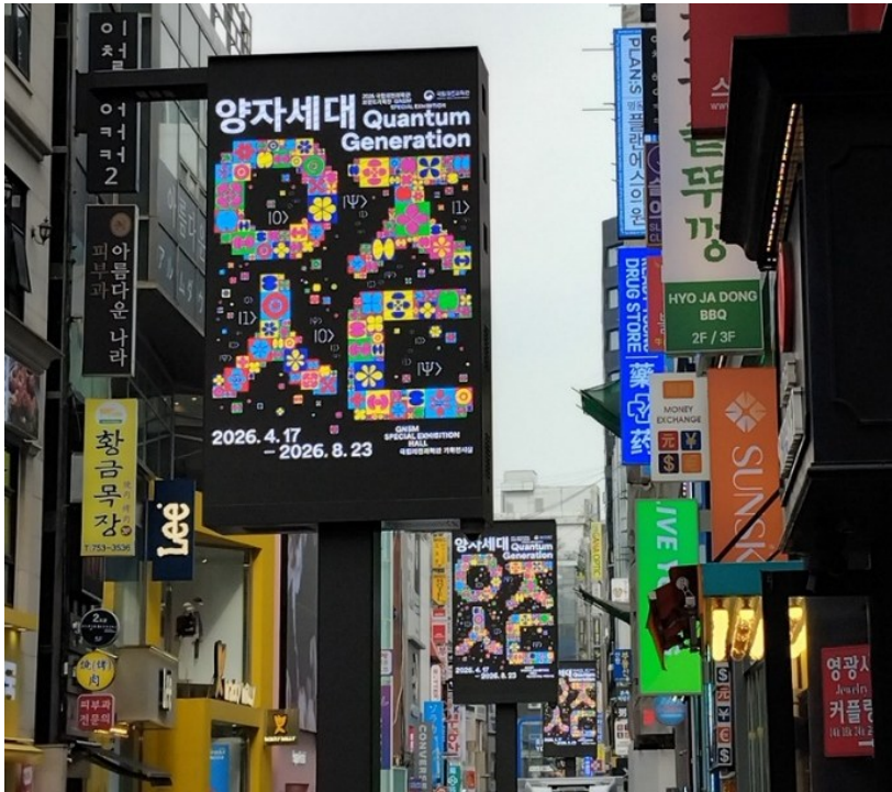
Färgglada skyltar finns det mycket av i Seoul.