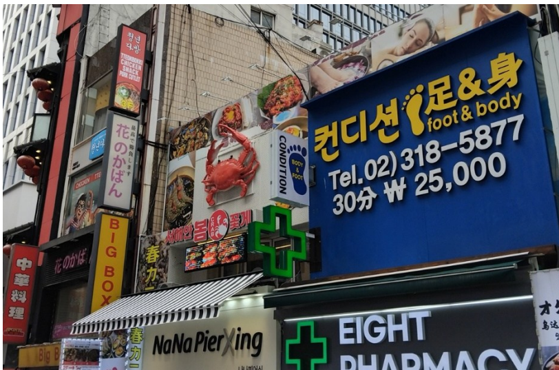
More is more.