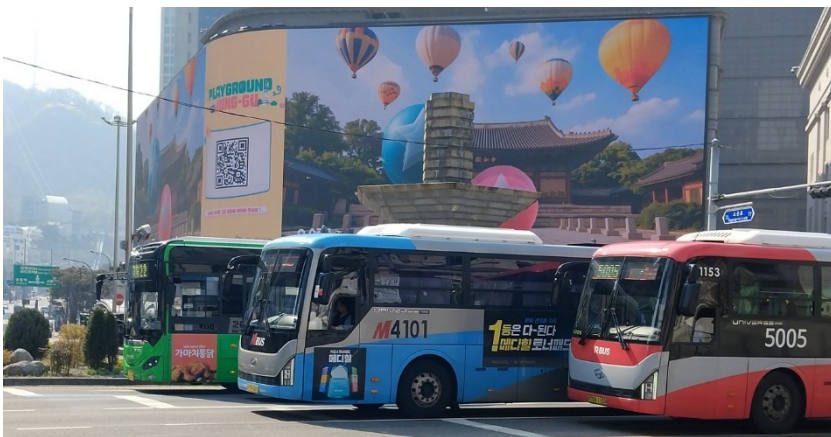
Färgkodade bussar och en bildskärm hög som ett femvåningshus.