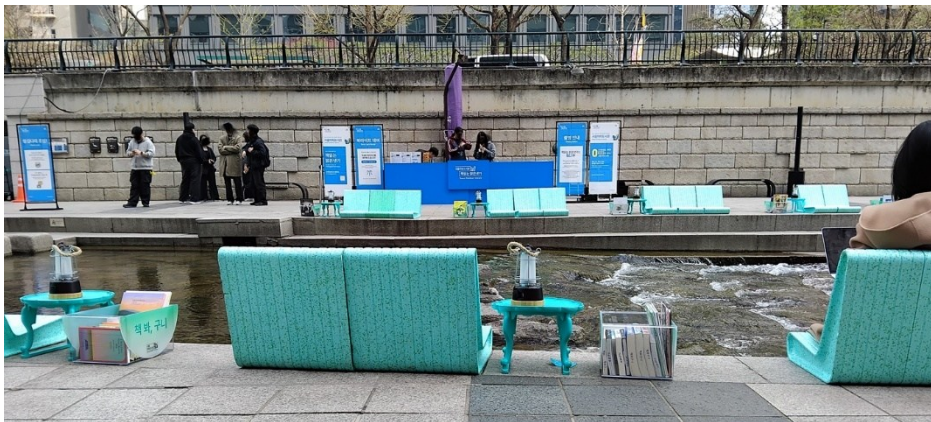
Del av bäcken och utomhusbiblioteket. Jag läste några sidor ur Fredrik Backman: My Friends , som fanns där.