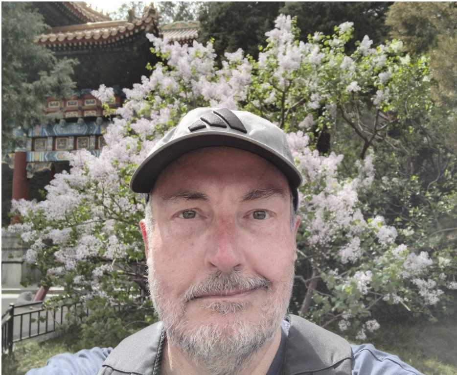
Syrenerna blommar i Peking