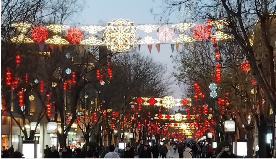
Gågatan här när jag kom åter