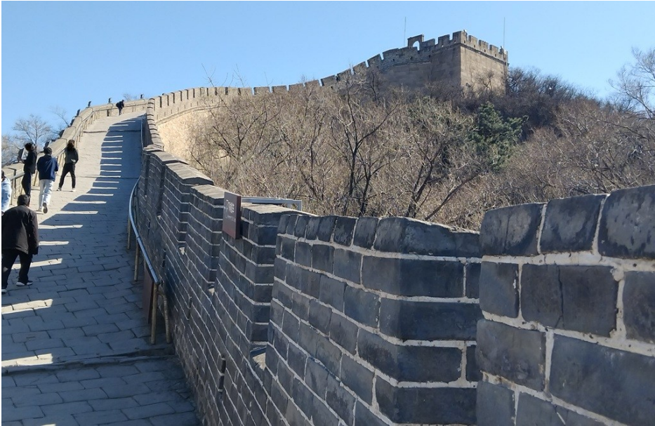
Ingen trängsel på södra murdelen.